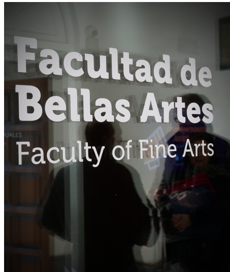
Combinaciones con horarios compatibles para PRIMERO del Grado en Bellas Artes

Los estudiantes de primer curso que sean admitidos en la preinscripción en el Grado en Bellas Artes deben tener en cuenta las combinaciones de grupos que tienen compatibilidad horaria. Cualquier otra combinación puede ocasionar un solapamiento de asignaturas.